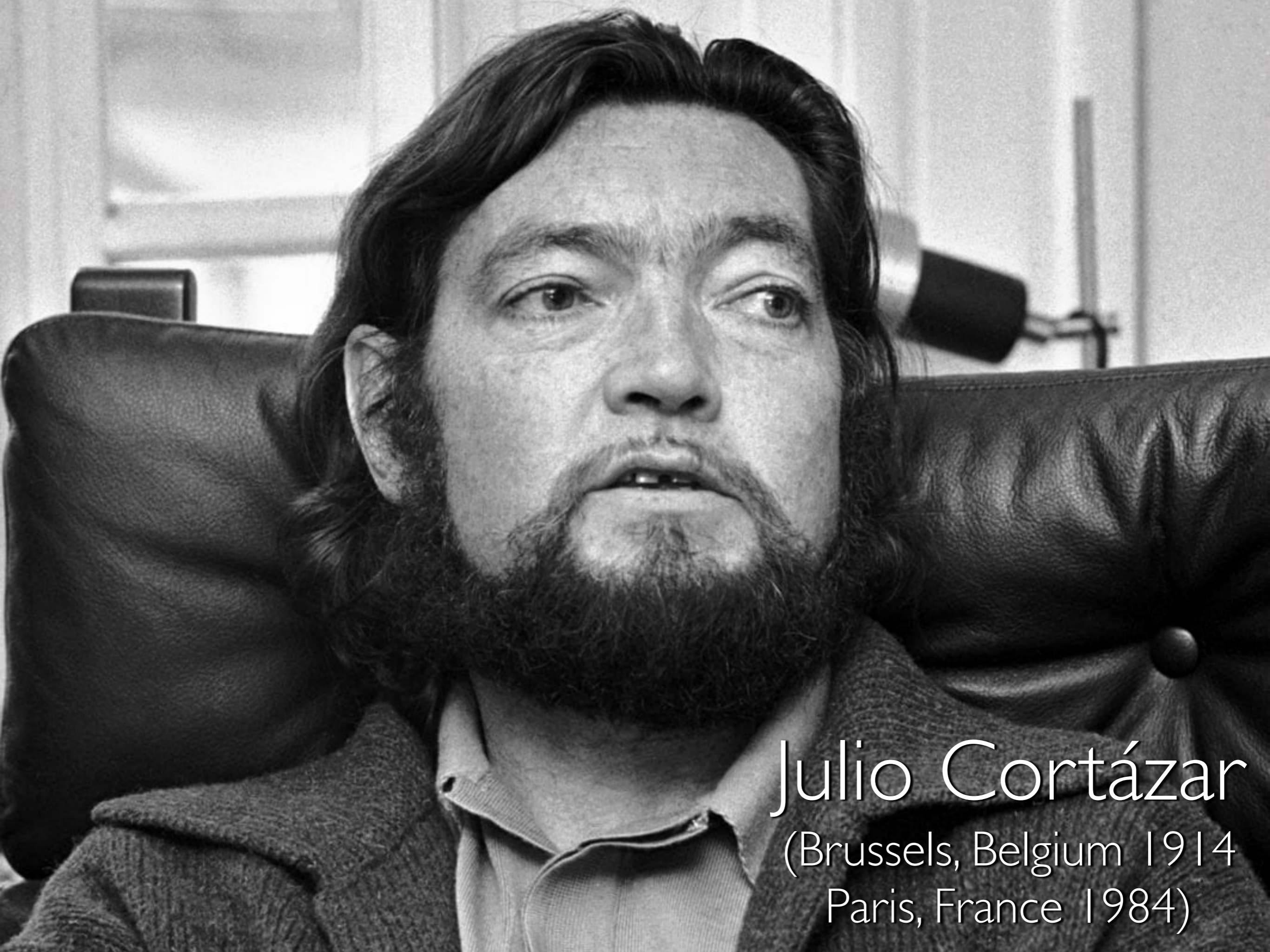
Julio Cortázar (Brussels, Belgium 1914 Paris, France 1984)