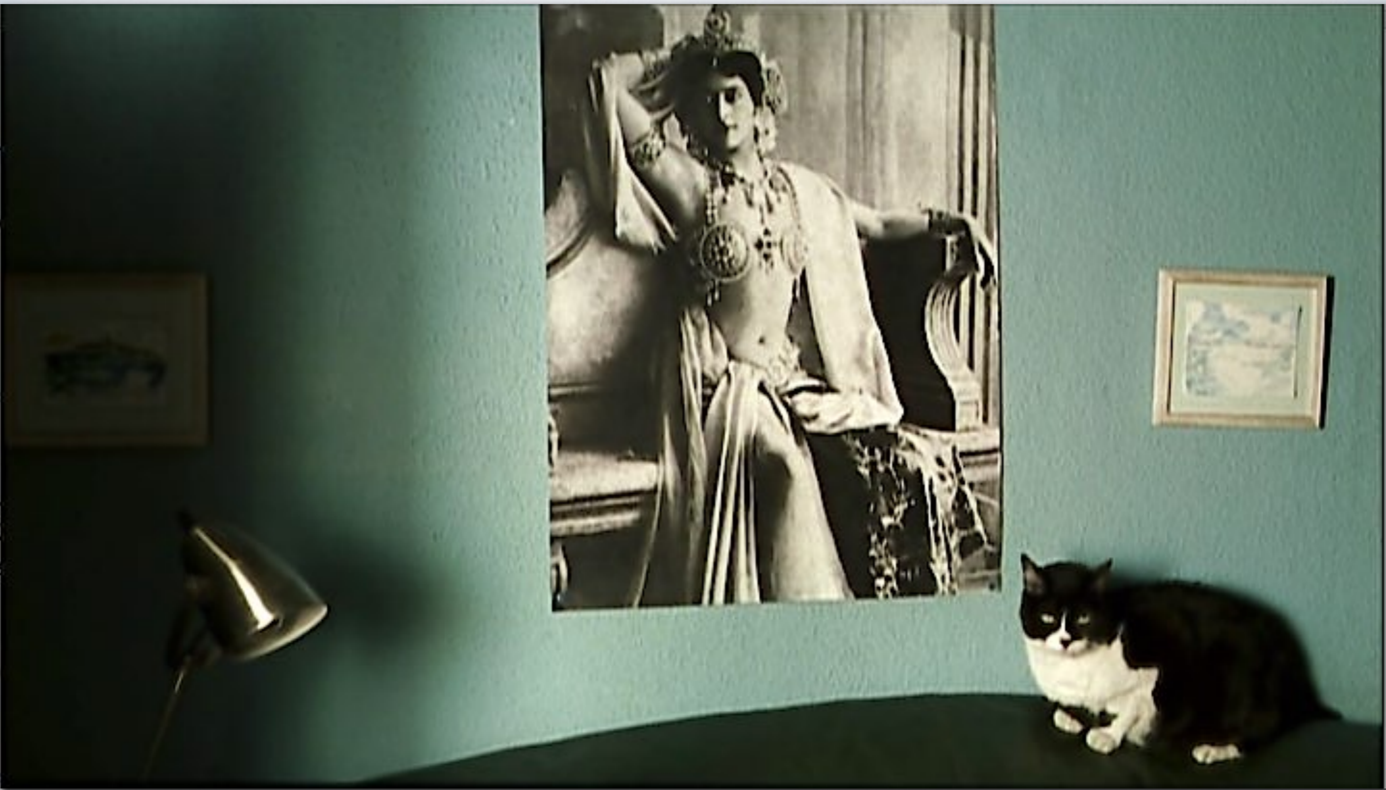
El piso de Inés en Mataharis (Icíar Bollaín 2007)