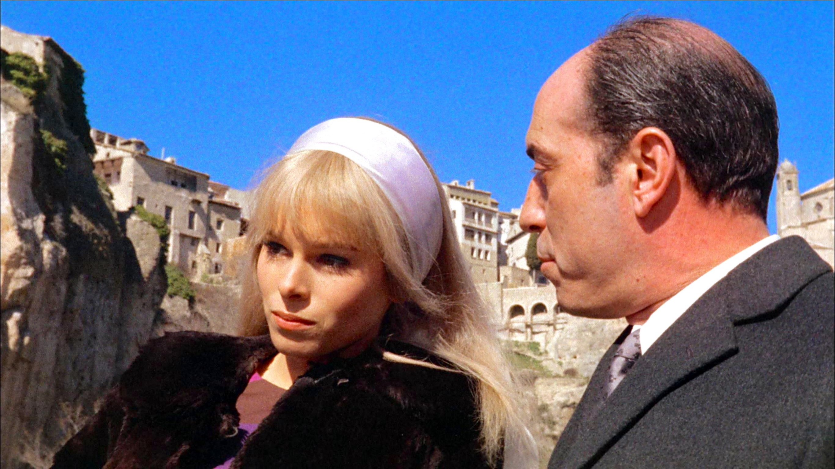
Peppermint frappé (Carlos Saura 1967)