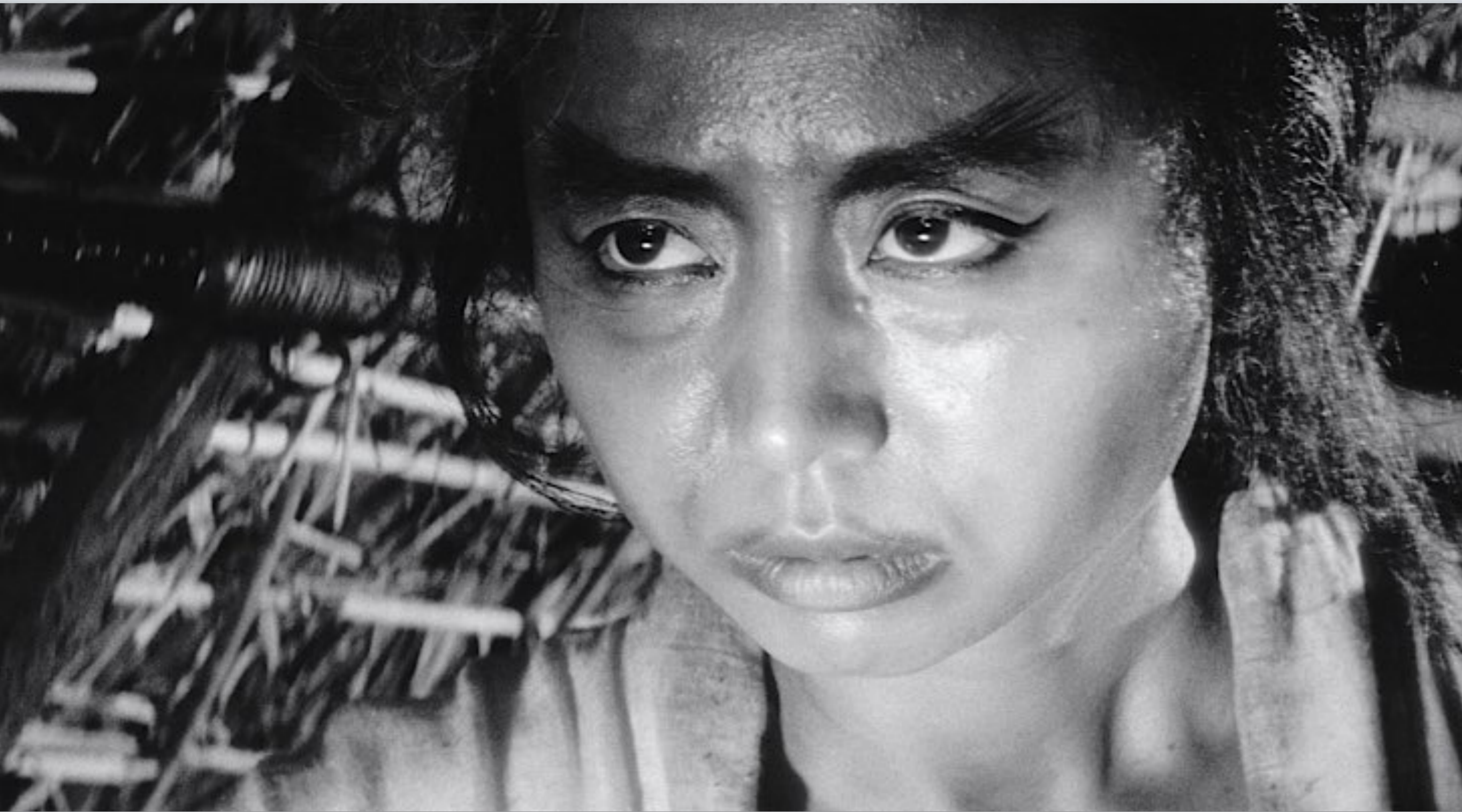
Onibaba (Demon Hag Kaneto Shindo 1964)