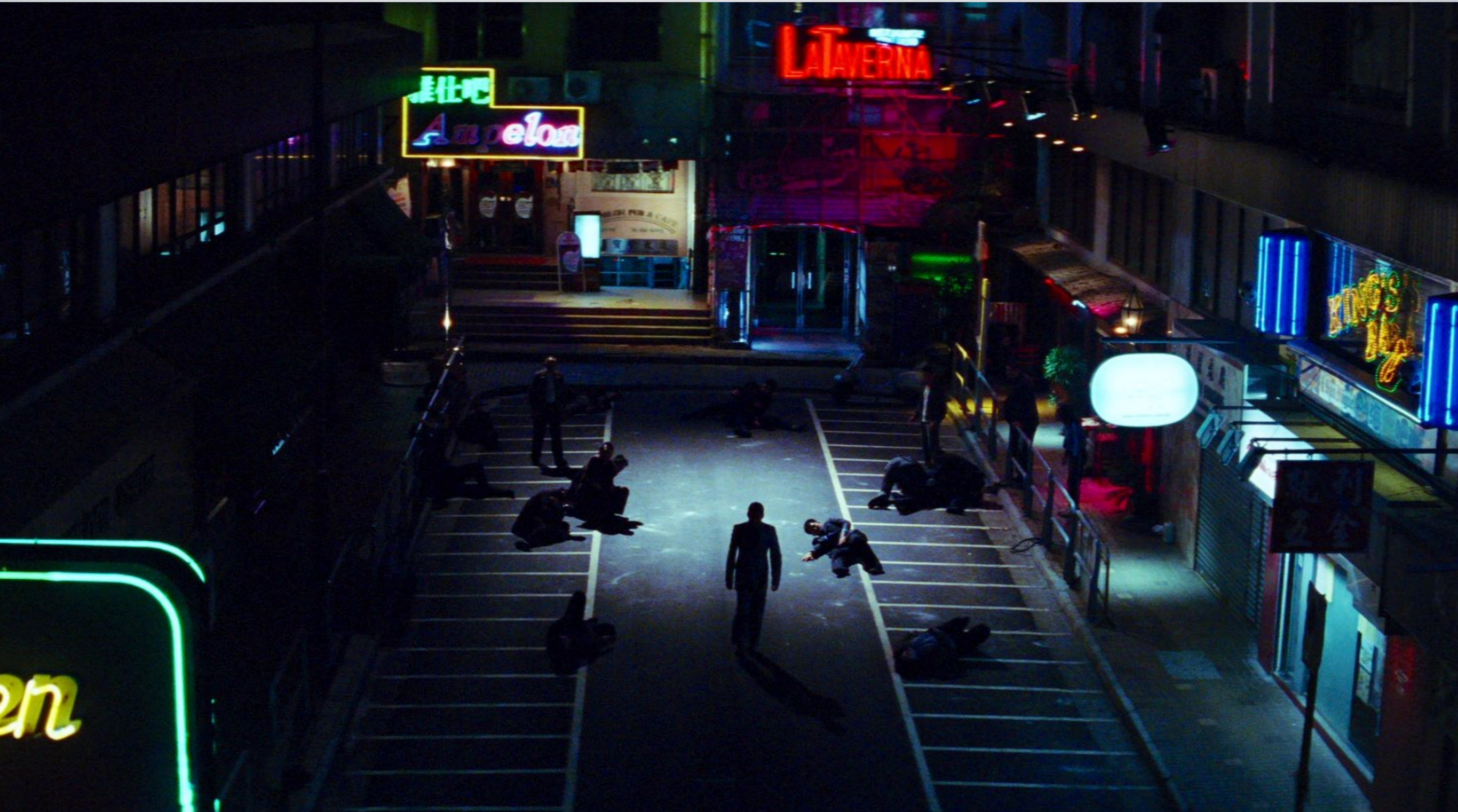
Throw Down (Johnnie To 2004)