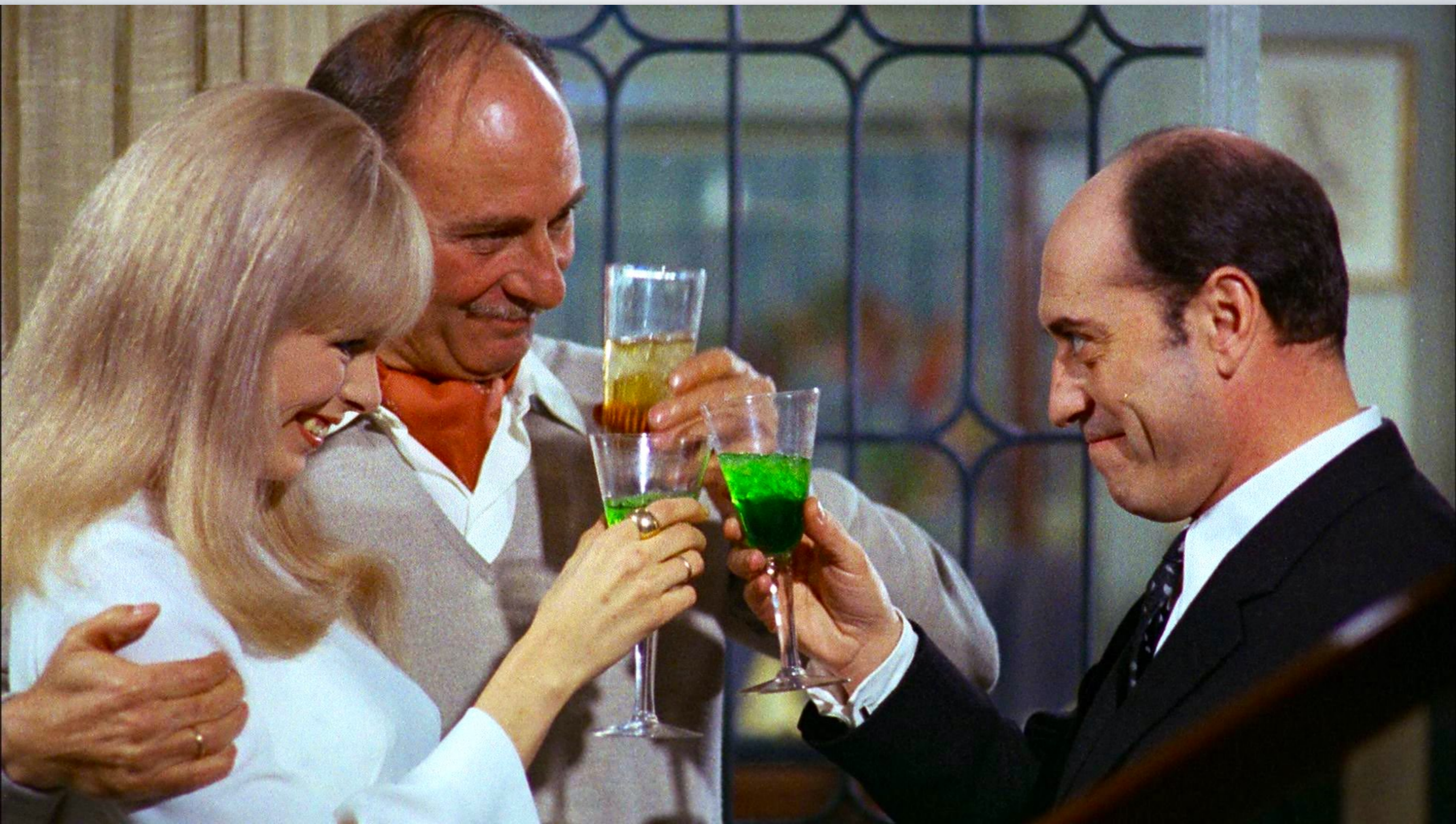
Peppermint frappé (Carlos Saura 1967)