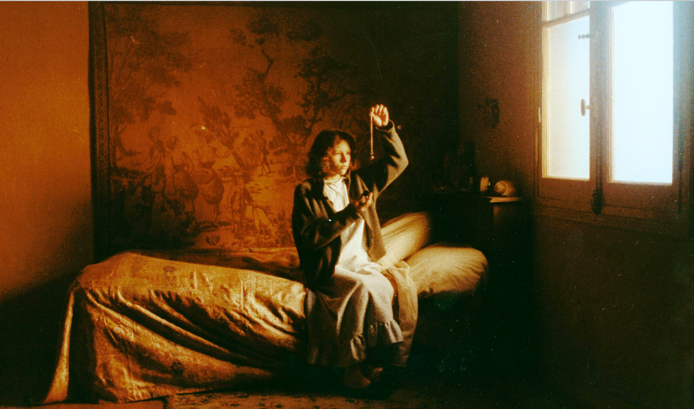
El sur (Víctor Erice 1983)