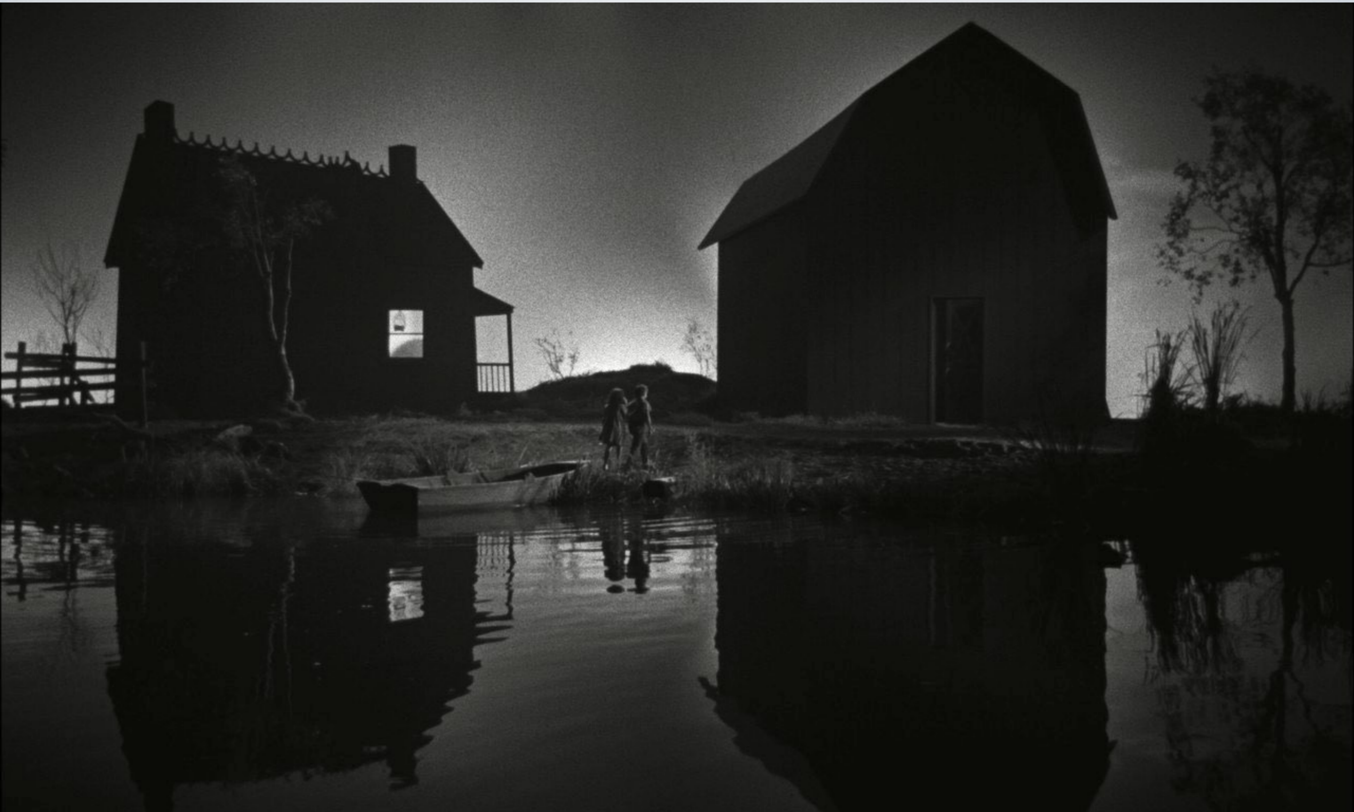
Night of the Hunter (Charles Laughton 1955)