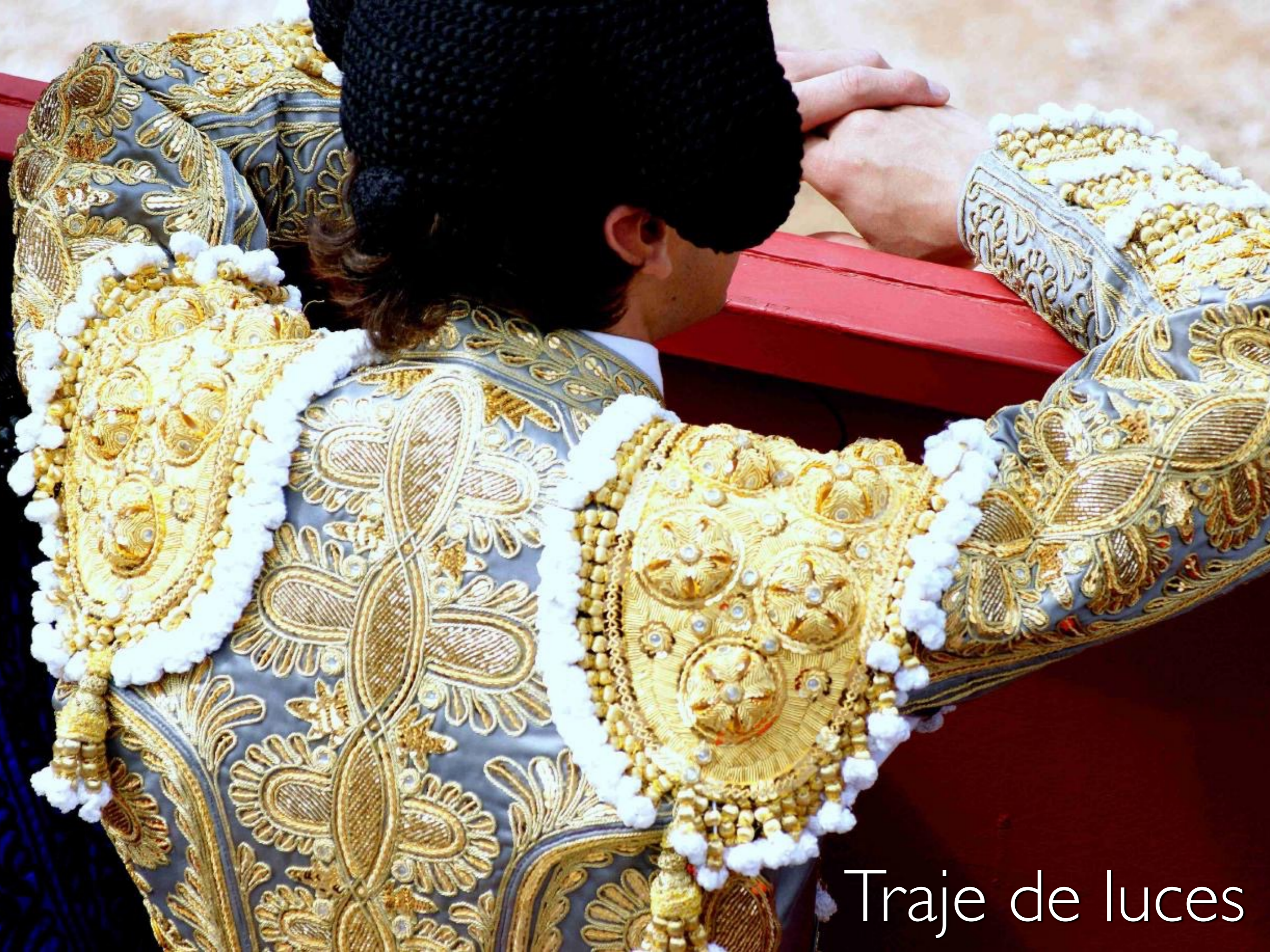
Traje de luces