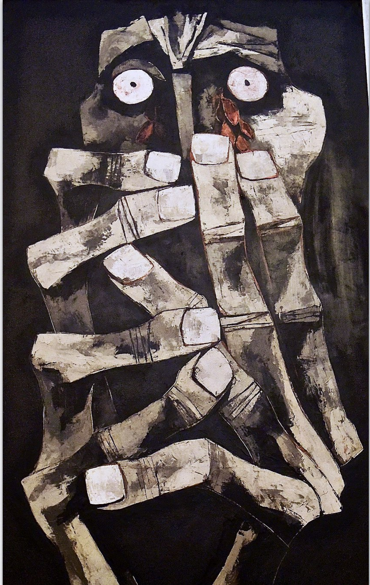
Oswaldo Guayasamín “Lágrimas de sangre” (1974)