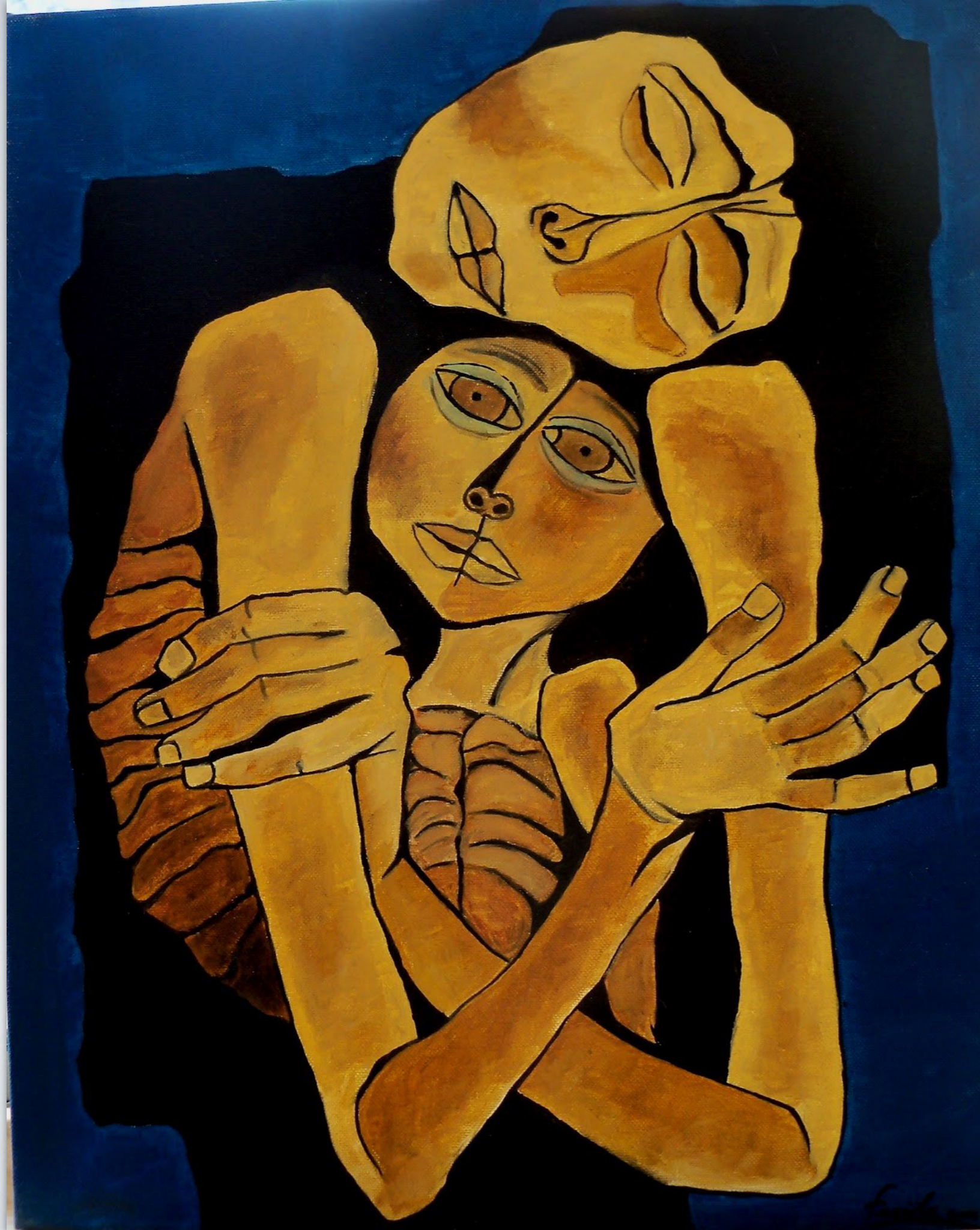
Oswaldo Guayasamín “Madre y niño” (1989)