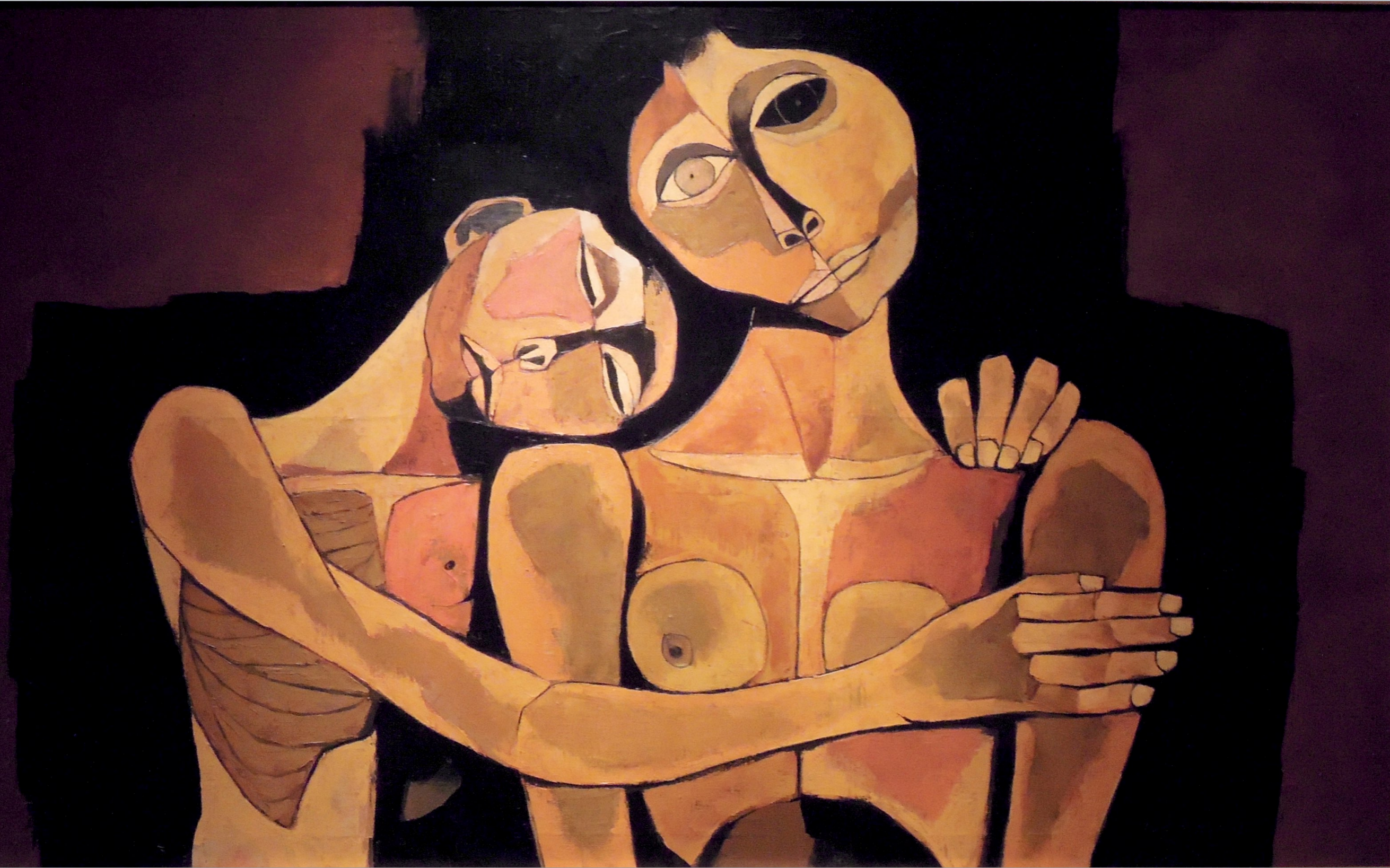
Oswaldo Guayasamín "Madre y niño" (1982)