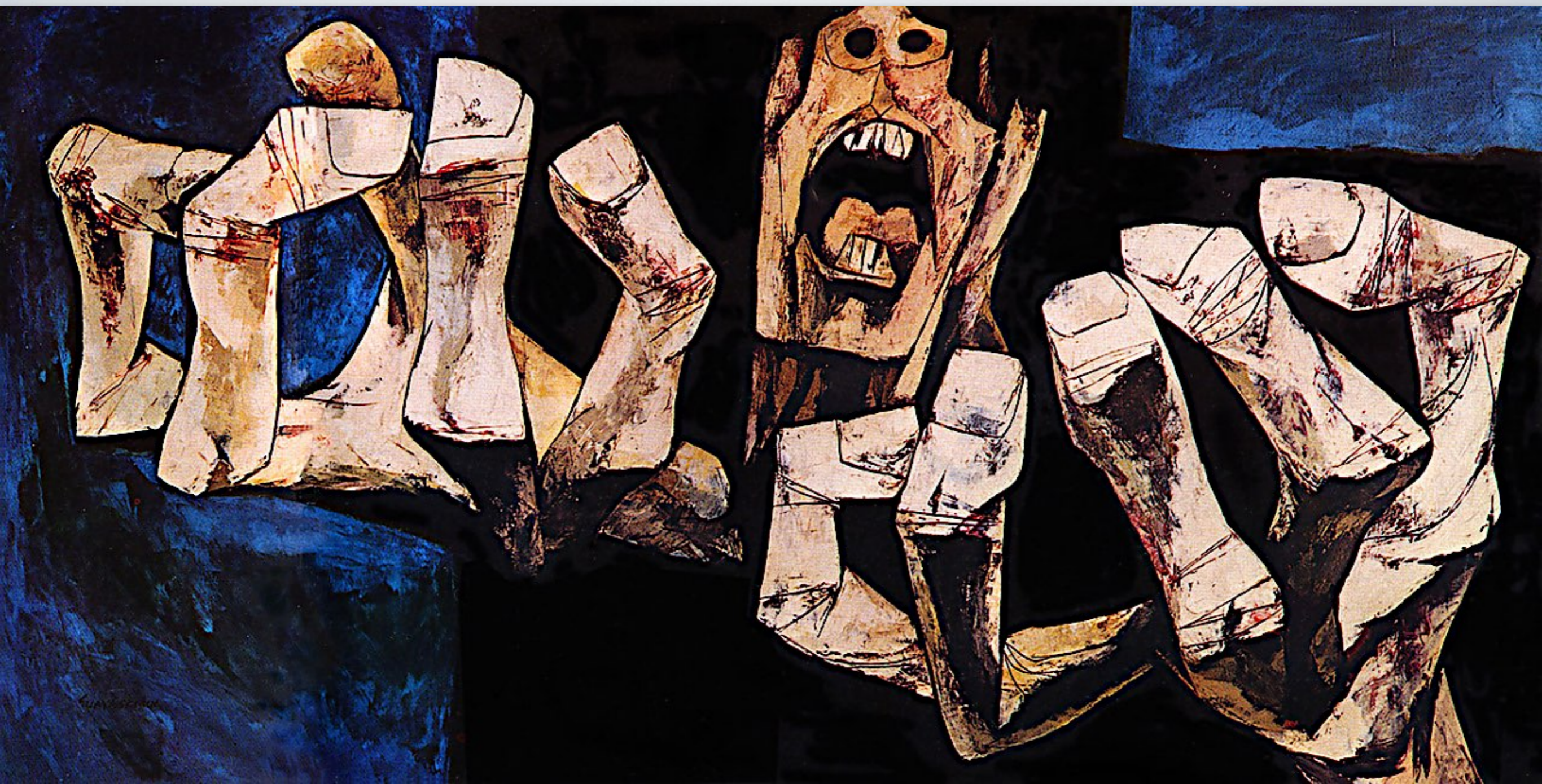
Oswaldo Guayasamín “Las manos de la protesta” (1968)