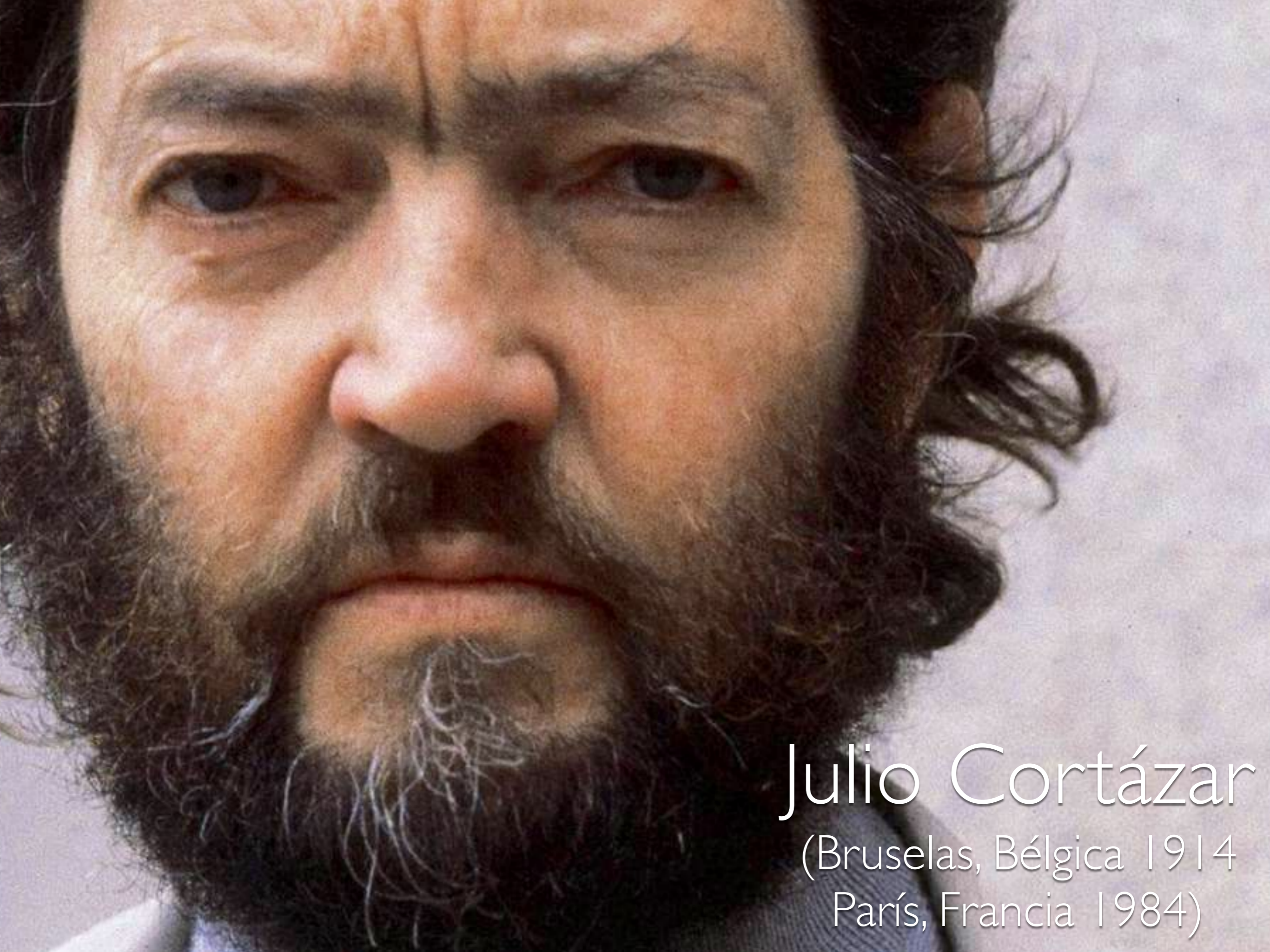
Julio Cortázar (Bruselas, Bélgica 1914 París, Francia 1984)