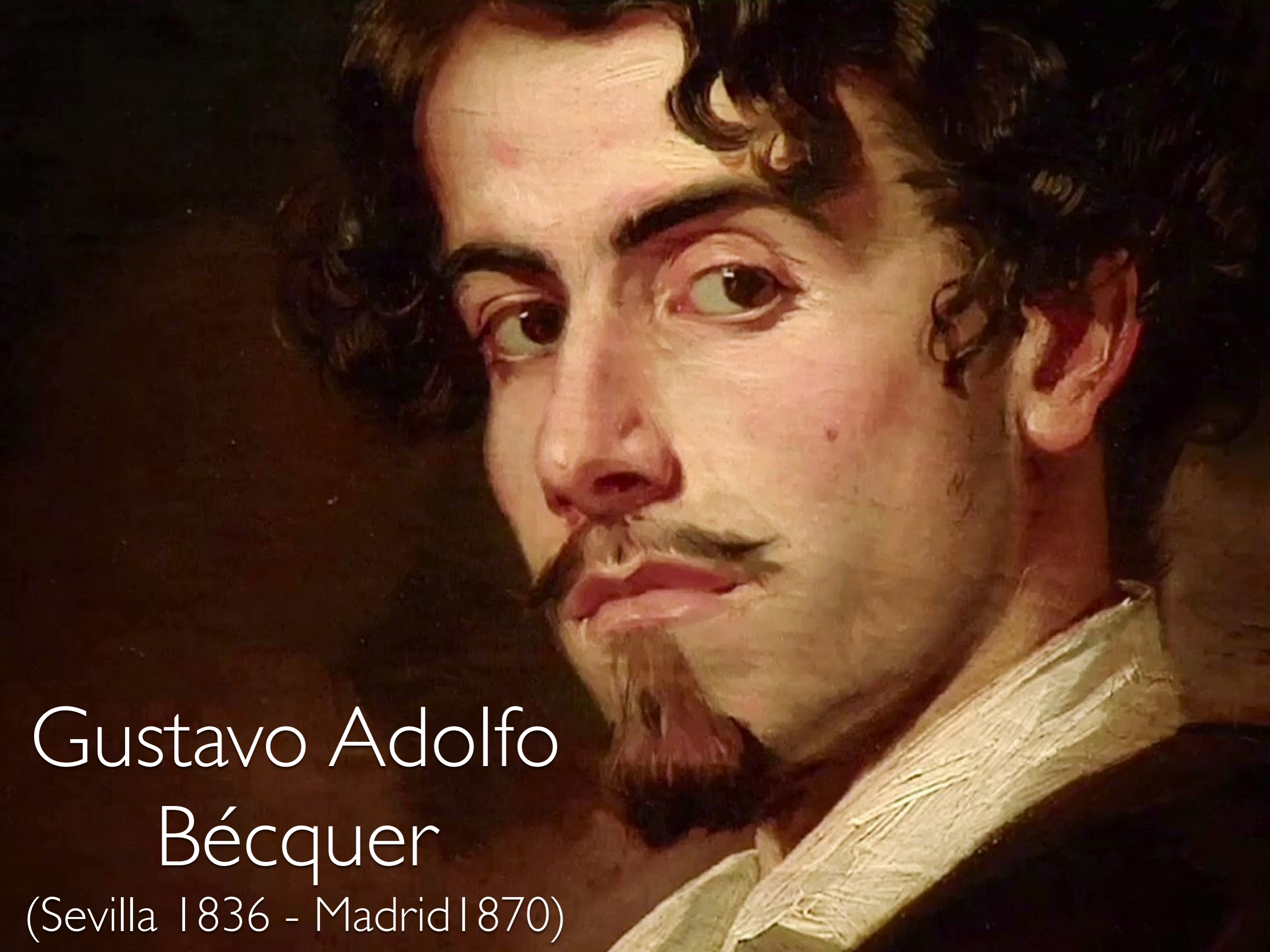
Gustavo Adolfo Bécquer (Sevilla 1836 - Madrid 1870)